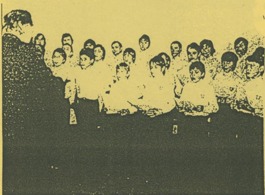
Les Petits Chanteurs au travail dans la joie.