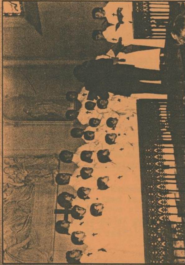
O Coral dos Meninos Cantores de Nossa Senhora de Andiran (França)

15 • JULHO • 1983 • 20:30 HS. INSTITUTO NOSSA SENHORA DO SAGRADO CORAÇÃO DIVINÓPOLIS - MG - BRASIL