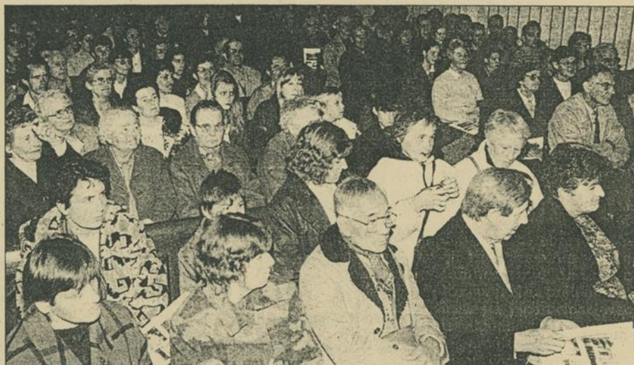
L'église de Grateloup était comble, samedi soir, pour assister à la prestation des Petits Chanteurs d'Andiran