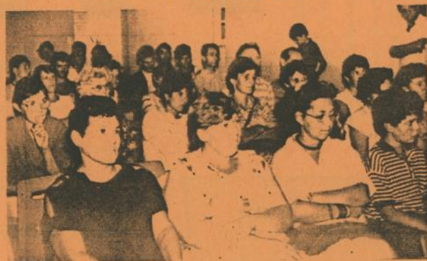
L'assemblée n'en revient pas encore !

Il reste à souhaiter maintenant que tous les gens de l'Albret recevront de bon cœur les sollicitations des Petits Chanteurs d'Andiran pour financer ce long et beau voyage.