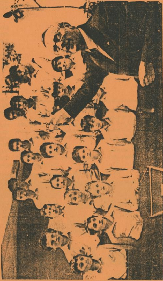
Le président national va agrapper le logo de ce trentième anniversaire sur le fanion des Petits Chanteurs d'Andiran.