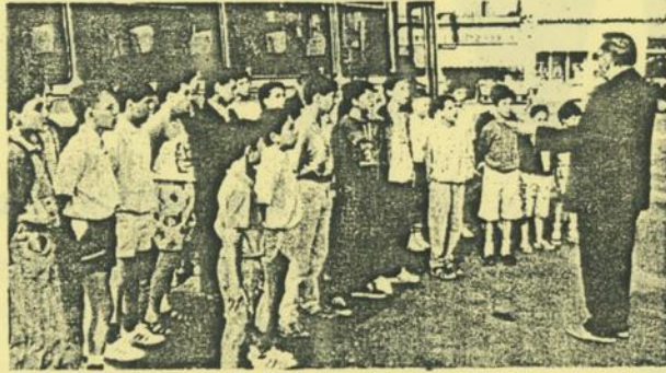
Ce n'est qu'un au revoir

Dès cette première journée, la chorale devait donner son premier concert à Sayat, dans le Puy-de-Dôme. Venaient ensuite des étapes en Alsace, en passant par l'Ain et Lyon. Près d'une vingtaine de concerts auront été donnés avant leur retour le 28 juillet. Entre temps, les Petits Chanteurs auront pu visiter plusieurs villes et régions telles le Luxembourg, le 17 juillet, puis une excursion en Allemagne le 20, une visite de Dinant et la vallée de la Meuse, la cathédrale de Chartres, Dreux, etc. Avec eux, les enfants ont emmené un répertoire de vingt-quatre chants dont « le Chant triomphal », « Salve Regina », « Hymne à la nuit », « Chant des adieux »... Durant leur séjour à l'extérieur, les Petits Chanteurs seront logés dans des familles d'accueil.