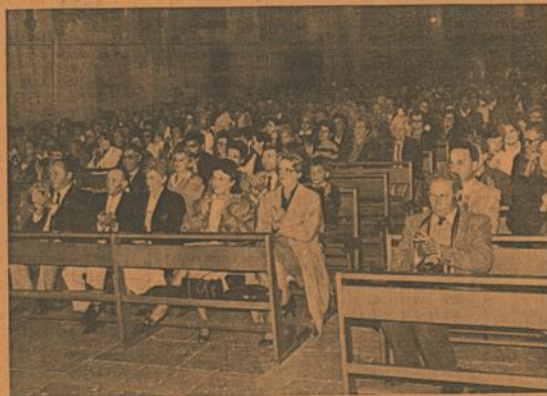
Une église bien remplie.

Dès lors, chacun était prêt à recevoir le « Requiem » où se sont mêlés harmonieusement aux voix les instruments à vent et de percussion de la Lyre agenaïse. Une pièce en sept parties alternant des thèmes serrens et apaisants à la joie d'exaltation. Jérémie et Laurent, les deux solistes, auront l'occasion de faire parcourir des frissons dans les travées, gage d'une commission exceptionnelle entre les artistes et le public. Une très grande soirée.