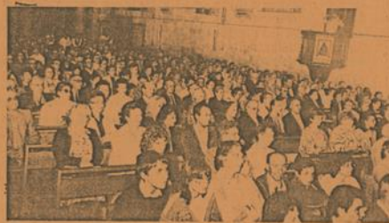
Une église comble