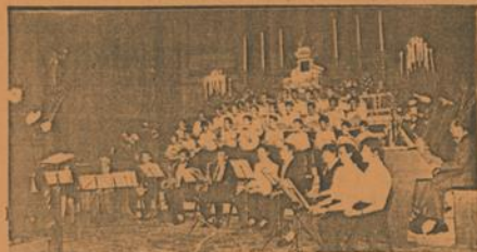
Une superbe interprétation