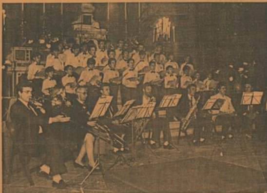
Les Petits Chanteurs lors du « Requiem ».