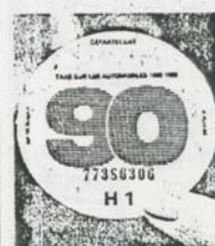
Une vignette bleue, cette année