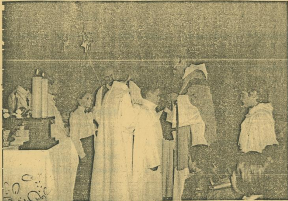
Mgr SAINT-GAUDENS remet la croix aux nouveaux Petits Chanteurs.

Après deux mois d'essai, les petits chanteurs sont admis officiellement dans la manécanterie. Ils sont alors présentés par un ancien qui est leur parrain. Dimanche après-midi, trois nouveaux venus dans la