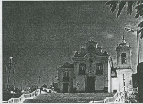
SAO JOAO DEL REY. La Cathédrale et le coteau qui domine la Ville.