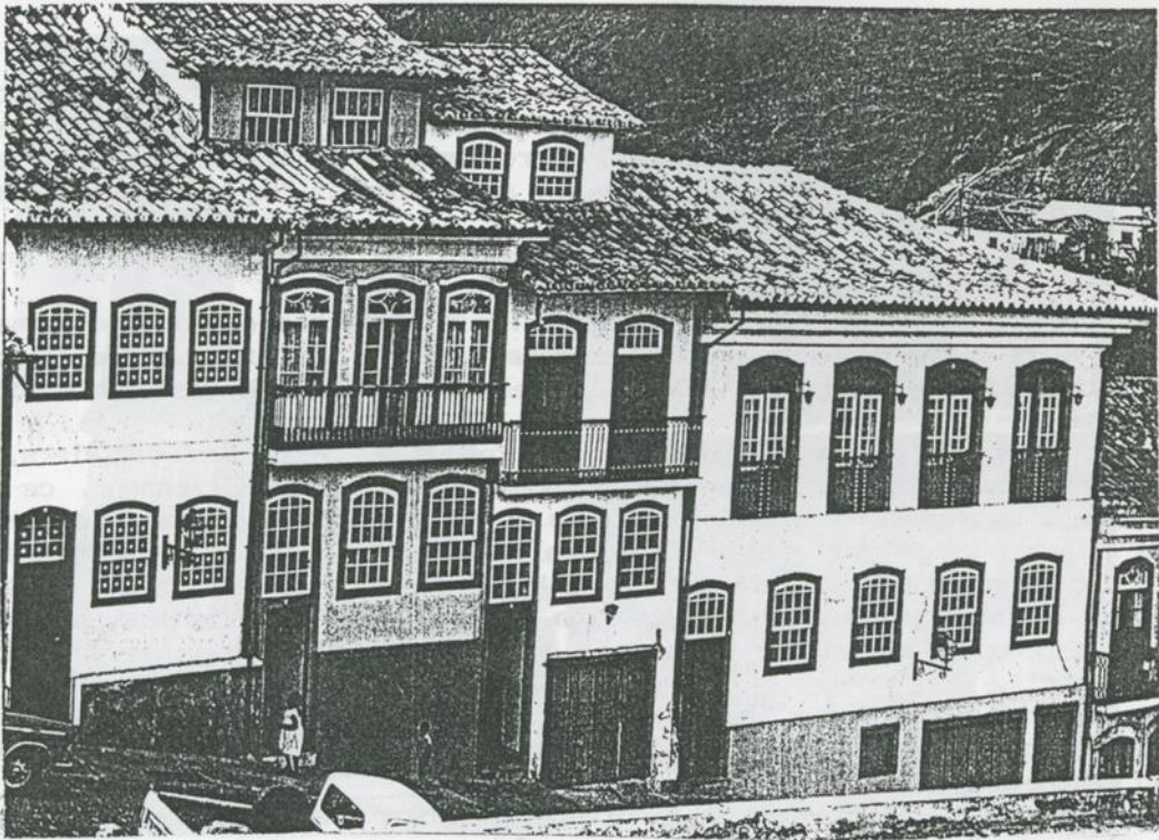
Dans l'Etat de Minas Gerais : Maisons de colons.