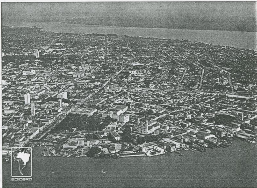
BELEM, dans une boucle de l'AMAZONE.