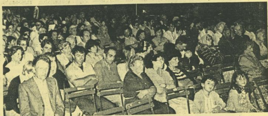
Un public hétéroclite était venu applaudir les jeunes garçons de la manécanterie d'Andiran