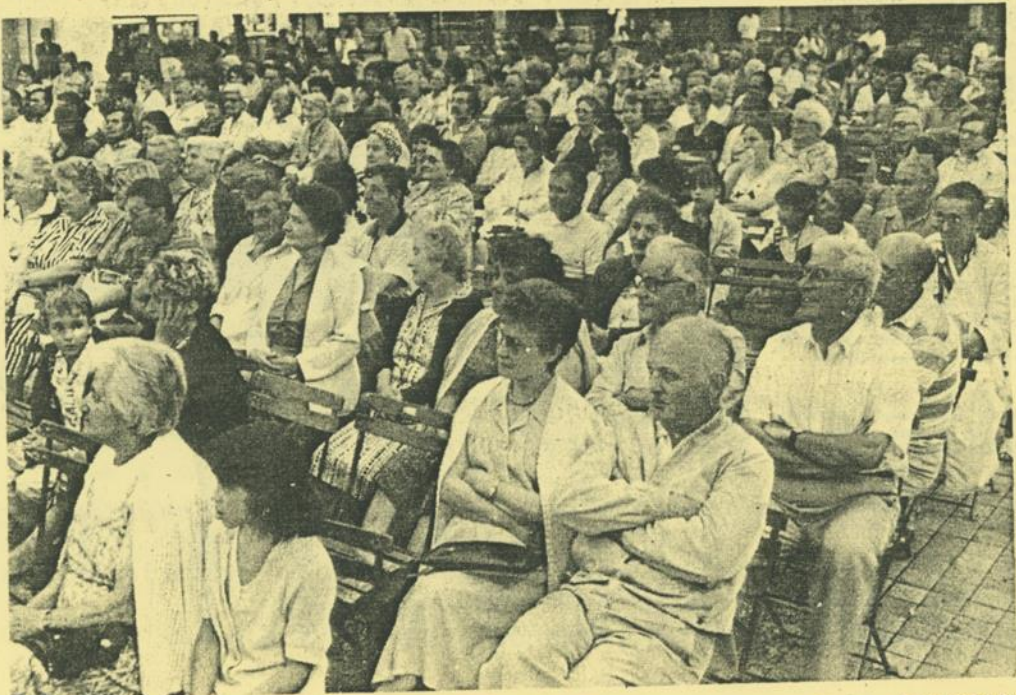
Le public était venu en nombre.

Mais pour l'heure, la chorale a les yeux tournés vers l'étranger où elle devrait prochainement se rendre. Déjà une tournée en Italie – à Rome notamment – a été prévue... L'Allemagne et la Suisse seraient également au programme de cette tournée pour laquelle les Petits Chanteurs répètent déjà quelques uns des plus beaux chants français.