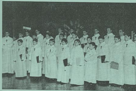
Les trente-six Petits Chanteurs d'Andiran, qui fêtent, cette année, leur trente-cinq ans d'existence, ont débuté leur concert de prestige par un grand motet espagnol...

Une manécanterie (1) comme celle d'Andiran, par exemple, n'est pas une chorale comme les autres car on n'y vient pas seulement pour chanter mais aussi pour se former, a notamment expliqué l'abbé de Smedt, directeur du chœur de garçons du pays d'Albret. Insistant sur ce caractère éducatif de la formation, il a ensuite loué ses vertus en ci-