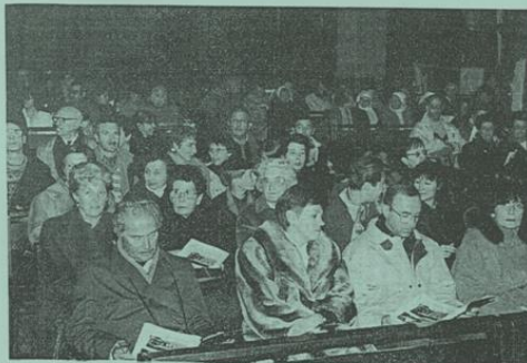
Environ deux cent cinquante personnes étaient présentes, samedi soir, à la cathédrale, pour écouter avec recueillement les chants interprétés par la manécanterie...