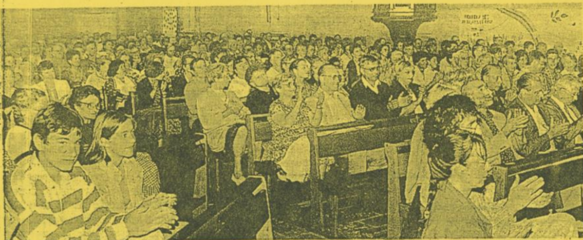
Un public très nombreux pour ce concert de prestige et d'anniversaire

La famille des Petits Chanteurs d'Andiran a vécu un de ses grands moments mercredi soir, en l'église Saint-Nicolas de Nérac, entre musique et émotionnel.